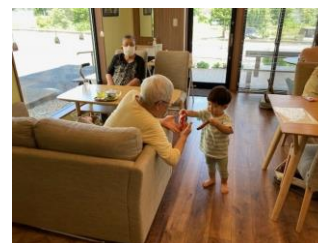
常設型通いの場の様子