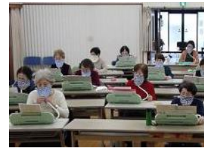
運動や音楽サポーターによる介護予防活動