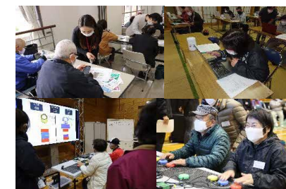
⑦スマホPC教室・UDeスポーツ