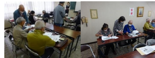
スキルアップ講座