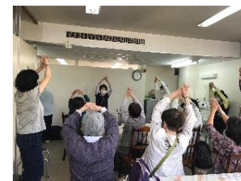
にこにこ・オレンジカフェいわくら