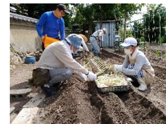
いわくら農園倶楽部