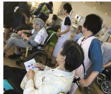
高齢者施設のお手伝い