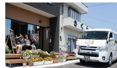
デマンド乗合タクシー

地域サロン、介護福祉施設、社会福祉協議会などが催し物の企画や準備に協力し、地域が一体となっておまつりを作り上げた。