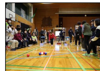
⑤通いの場対抗ポッチャ大会