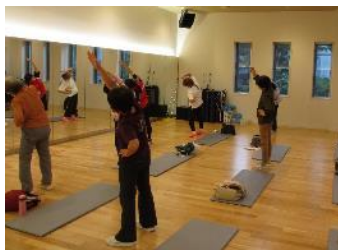
希望者は運動教室に参加 （医学的根拠に基づいた運動プログラム）