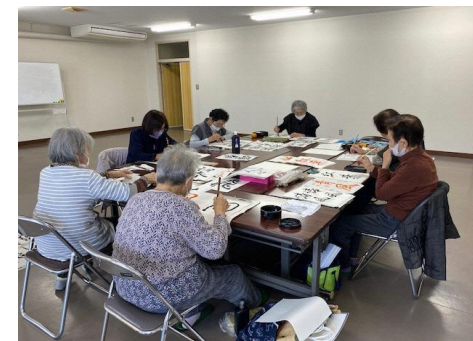
趣味活動のサポート