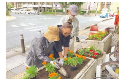
オレンジガーデニングプロジェクトの様子