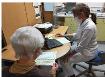
市内医療機関にて 認知機能チェックの実施