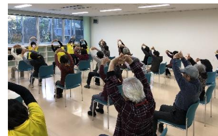
おまえざき体良（たいりょう）体操