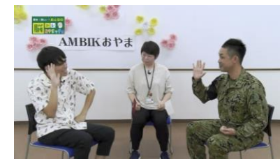
災害派遣の縁で防災情報を提供