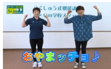
ケーブルテレビで番組放送