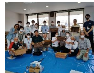
男たちの作業工房