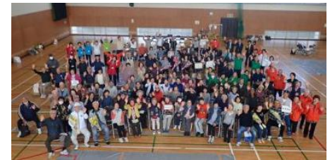
ポールンピック大会（決勝大会）