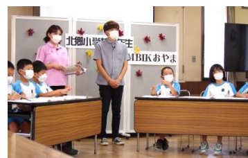
小学生の参加・福祉体験