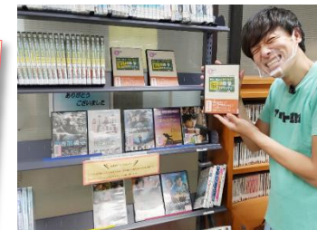
小山町図書館のDVDコーナー (これまでの全放送分が並んでいます)