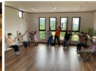
笑いヨガ教室の様子