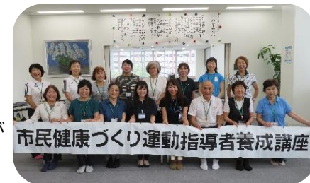
運動指導者養成講座