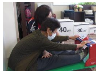
運動教室の前後で認知機能 及び体力測定を実施