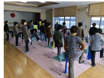
おまえざき介護予防運動指導士養成講座