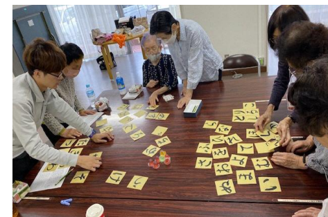
高齢者の居場所の提供