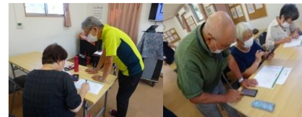
スマートフォン基礎講座