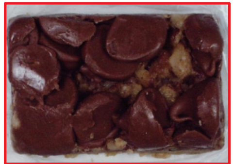
Pastel de cannabis