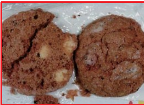
Galletas de cannabis