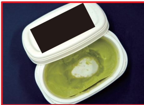
Mantequilla de cannabis