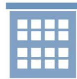
年金事務所・ 市区町村の年金窓口