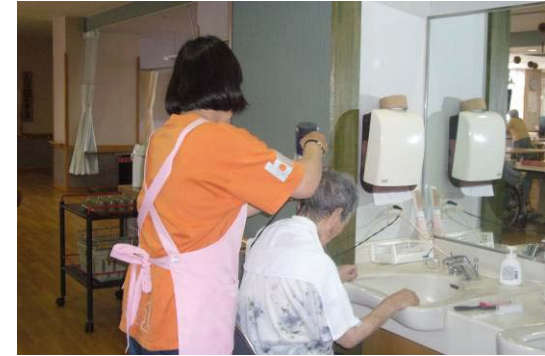
↑入浴後の整髪のお手伝い

お年寄りの話し相手・お茶くみ・レクリエーション補助等 尚、お子様の同行は出来ませんのでご了承下さい。