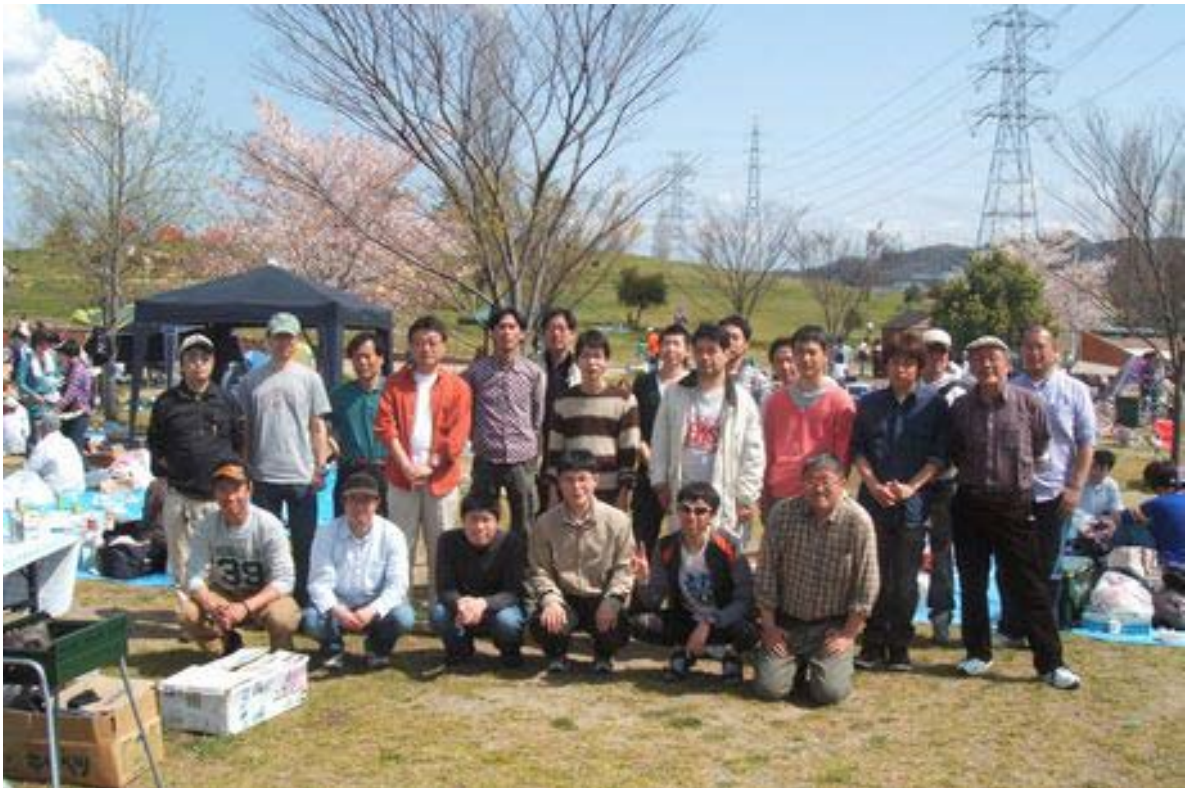
枚方市 山田池公園 大阪・京都交流会