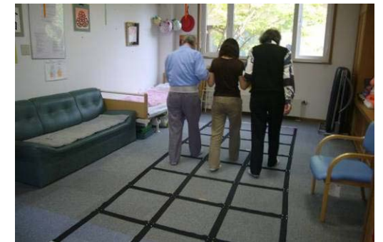
↑フマネットですく楽しく歩行訓練中