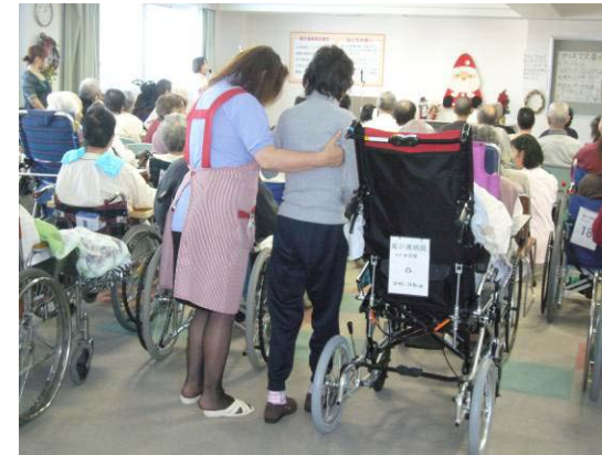
↑病院のクリスマス会で患者さんのお手伝い

脳梗塞等で入院され、「回復期」を迎えている方の 「話し相手」やレクリエーションのお手伝い (レクリエーションや会話がハビリの的な役割を果たします。) 様々な年代の患者さんがいらっしゃいます。