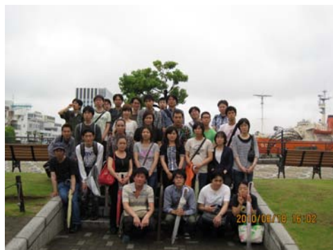
レクリエーション風景