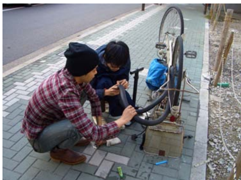
地域のための自転車修理