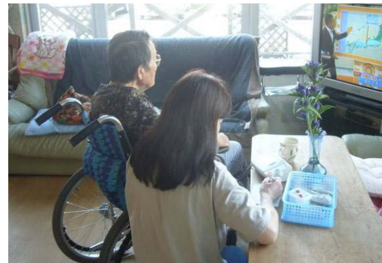
↑入浴前の体調チェック

入居者ができることは温かく見守るようにしましょう。主にトランプ・カルタ・折り紙等レクリエーションやお話し相手をお願いします。