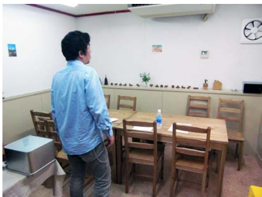
お店の内部とスタッフ