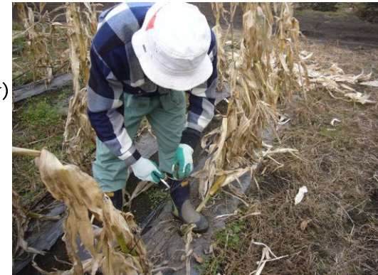
↑収穫後の後片付け