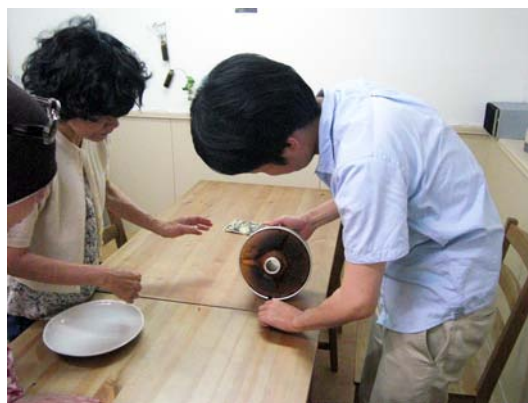
ケーキ作りの指導