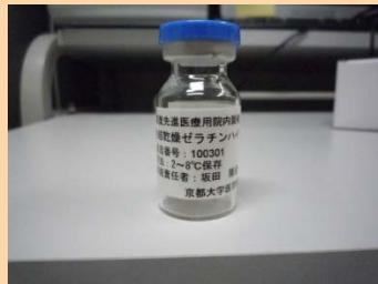
凍結乾燥後バイアルに充填