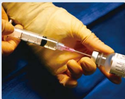
1時間前に生理食塩水に溶解した b-FGFを加えゼラチンハイドロゲルを 膨潤させる