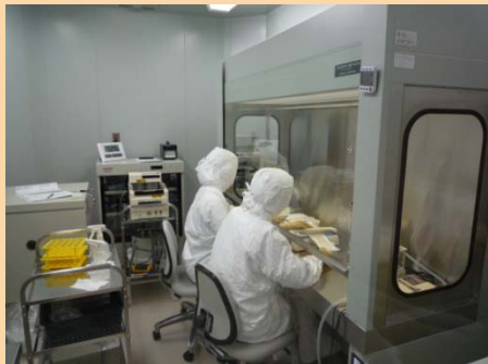
ゼラチンハイドロゲルを製造