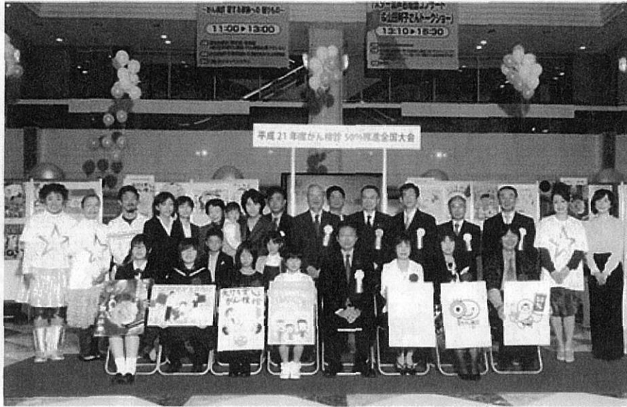
平成21年度がん検診50%推進全国大会最優秀表彰式