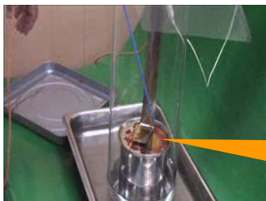
ボンゴール消毒液10%