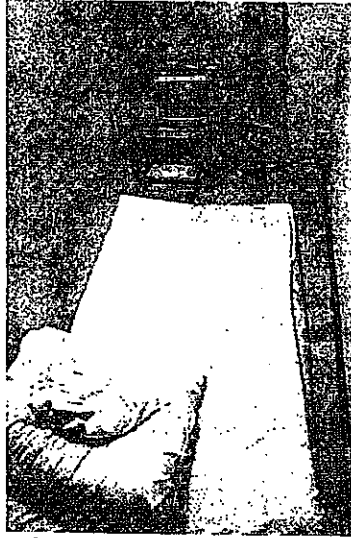
6畳間をベニヤ板(左)で仕切った居室。布団を敷けば足の踏み場もなくほどの狭さだ。名古屋市内