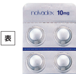
ノルバデックス錠10mg