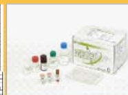
ライセンスアウト