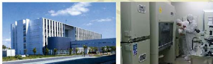
北大創成科学共同研究機構（左）とCPC