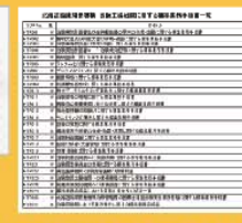
医師主導治験標準手順書