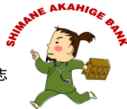
医師募集キャラクター 赤ひげ先生