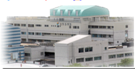
長崎県上五島病院