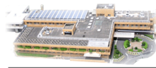
長崎県上対馬病院