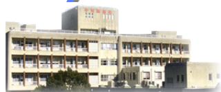
長崎県中対馬病院