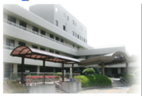
長崎県対馬いづはら病院