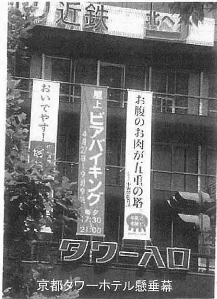
京都タワーホテル懸垂幕