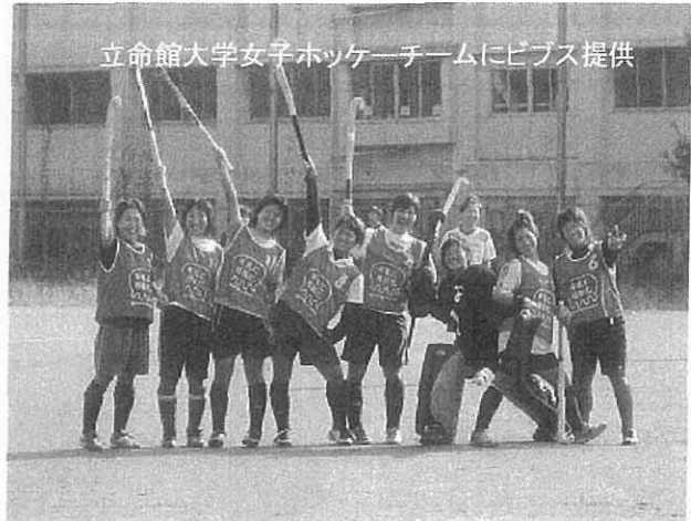
立命館大学女子ホッケーチームにピブス提供