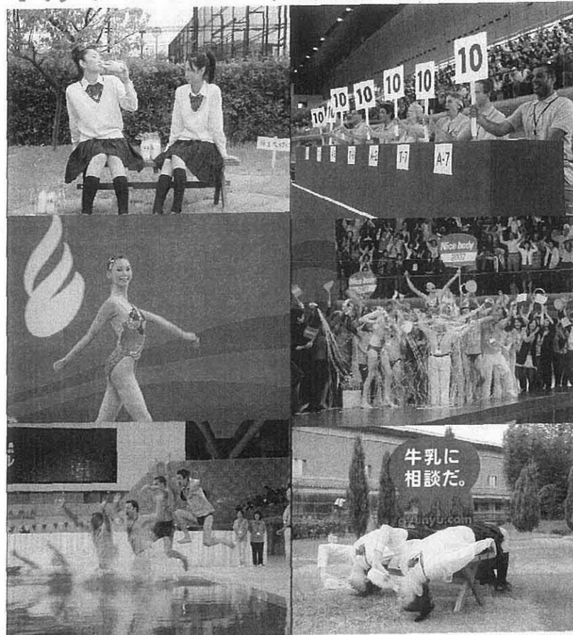
【シンクロ編】 【チョーク編】