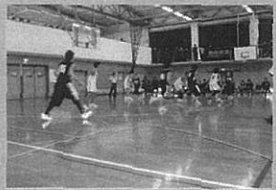
バスケットボール部練習風景