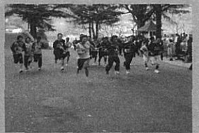
駅伝大会での雄姿