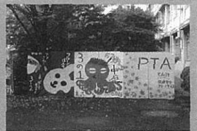
紅葉祭での宣伝看板