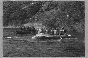
修学旅行でのラフティング