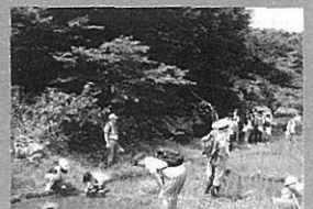
地域研究「恩田の谷戸」