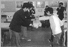
エコキャップによる地域連携