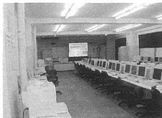
パソコン室 コンピュータの操作、ソフトの使い方などを学びます