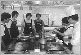
総合Bでの職場体験