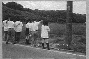
地域研究で「へび山」散策