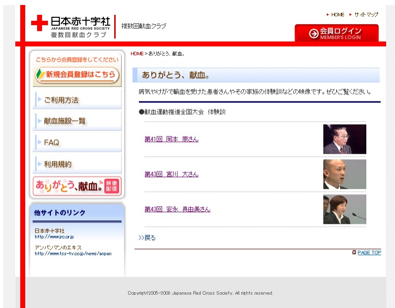
(パソコンの映像配信画面)

また、病気やけがで輸血を受けた患者さんやその家族の体験談について、その映像を視聴できる映像配信機能を会員専用WEBサイトに構築し、医療における輸血の重要性や血液の使われ方の理解促進とともに献血意欲の向上を図っている。