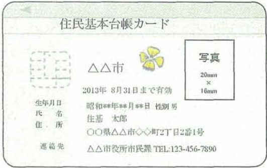
(ICチップ部分のイメージ)