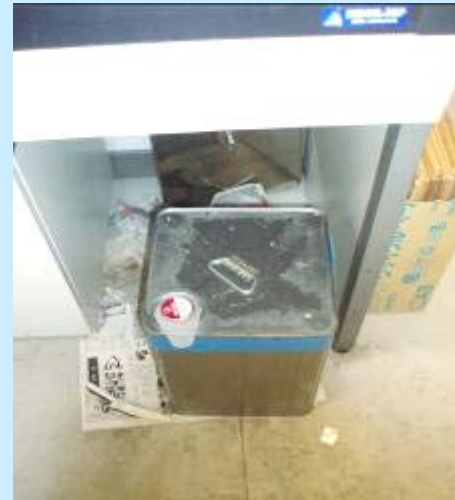
ホルマリン容器の密閉