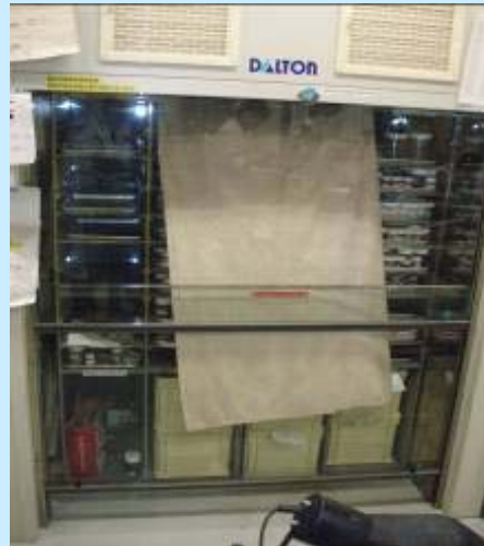
整理整頓 & 密閉