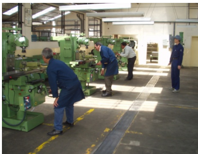
専門家による技術移転風景