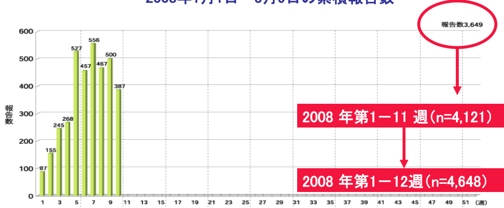
図1. 麻疹報告数の週別推移 (2008年第1～10週)