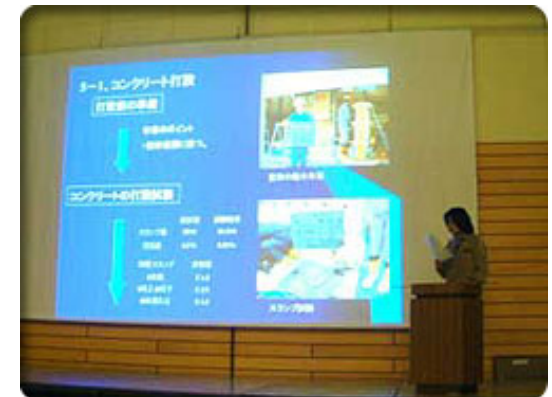
RC施工実習のプレゼンテーション