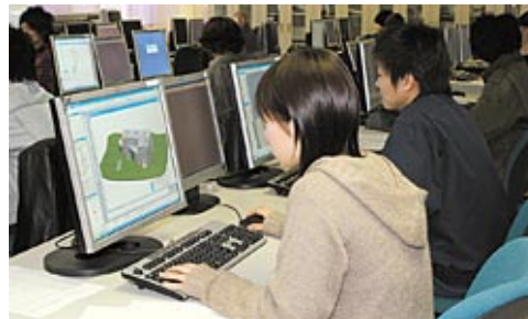
建築設計実習（CAD実習）