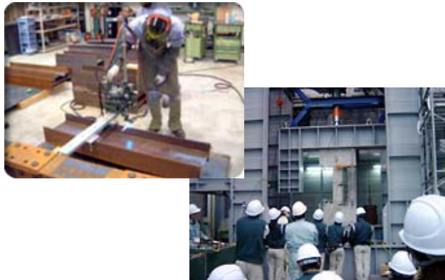
施工管理の基礎を理解するための施行実験実習