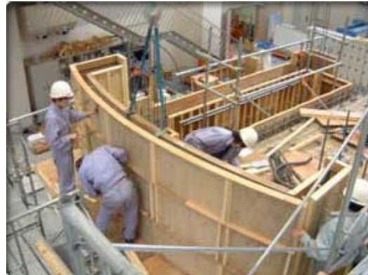
グループ別課題による、鉄筋コンクリートの施工実習