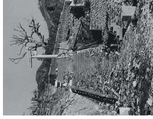
山王神社 (片足鳥居)