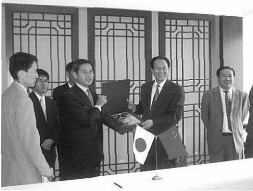
中国民用航空総局との覚書締結

航空・鉄道事故調査委員会は、事故調査に関して国際的に幅広い意見交換を行い、連携を深めることを目的として、平成6年9月から、航空事故調査に関する国際組織「国際航空事故調査員連合(ISASI)」に、平成18年5月からは、航空・鉄道他各モードの事故調査に関して、独立性を持った調査機関により構成される国際組織「国際運輸安全