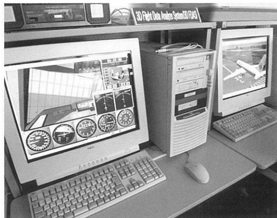
飛行航跡立体映像解析装置 ※飛行記録装置 (FDR) からの記録データをもとに 立体映像化する装置