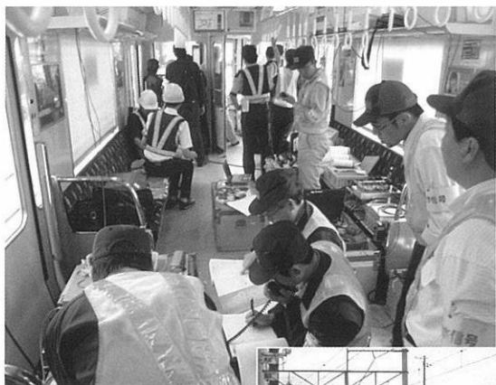
福知山線にて行われた 列車走行試験 (平成17年6月)

事実調査の結果得られた情報や資料に加え、事故原因を究明する上で必要とする場合、これに関連した試験及び研究を行います。試験及び研究