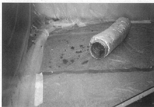
図1-1-23 ダクト内汚染の写真