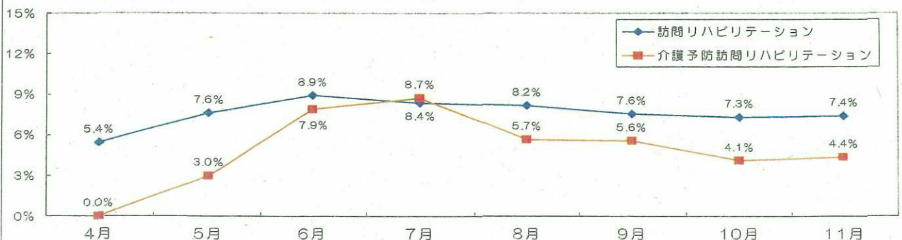
短期集中リハビリテーション実施加算の算定割合

注) 算定割合は、各施設のサービス日数に対する短期集中リハビリテーション実施加算算定日数の割合である。 *介護給付費実態調査(平成18年度各月サービス提供分)