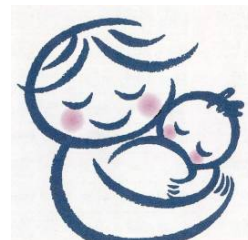
富山県母乳育児推進のシンボルマーク