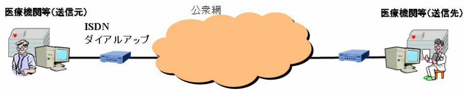
図 B-3-② 公衆網で接続されている場合