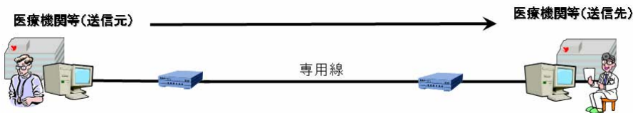
図 B-3-① 専用線で接続されている場合

ただし、品質は高いといえるが、ネットワークの接続形態としては拡張性が乏しく、かつ、一般的に高コストの接続形態であるため、その導入にあたってはやり取りされる情報の重要性と情報の量等の兼ね合いを見極める必要もある。