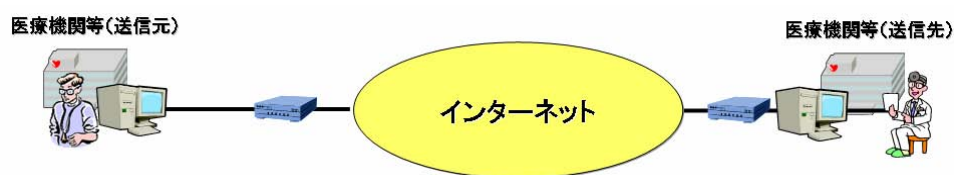
図 B-3-④ オープンネットワークで接続されている場合

このように、オープンなネットワーク接続を利用する場合、様々なセキュリティ技術が存在し、内在するリスクも用いる技術によって異なることから、利用する医療機関等においては導入時において十分な検討を行い、リスクの受容範囲を見定める必要がある。多くの場合、ネットワーク導入時に業者等に委託をするが、その際には、リスクの説明を求め、理解しておくことも必要である。