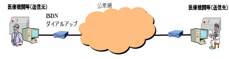
図 B-3-② 公衆網で接続されている場合

一方で、電話番号を確認する仕組みを用いなかったことによる誤接続、誤送信のリスクや専用線と同様に拡張性が乏しいこと、また、現在のブロードバンド接続と比べ通信速度が遅いため、大量の情報もしくは画像等の容量の大きな情報を送信する際に適用範囲を適切に見定める必要がある。