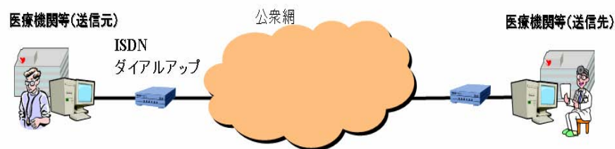
図 B-3-② 公衆網で接続されている場合

一方で、電話番号を確認する仕組みを用いなかったことによる誤接続、誤送信のリスクや専用線と同様に拡張性が乏しいこと、また、現在のブロードバンド接続と比べ通信速度が遅いため、大量の情報もしくは画像等の容量の大きな情報を送信する際に適用範囲を適切に見定める必要がある。