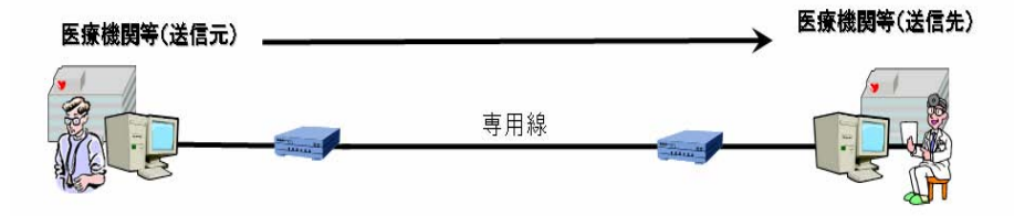
図 B-3-① 専用線で接続されている場合

ただし、品質は高いといえるが、ネットワークの接続形態としては拡張性が乏しく、かつ、一般的に高コストの接続形態であるため、その導入にあたってはやり取りされる情報の重要性と情報の量等の兼ね合いを見極める必要もある。