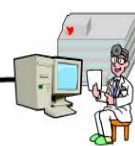
図 B-3-③-a 単一の通信事業者が提供する閉域ネットワークで接続されている場合