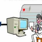
図 B-3-③-b 途中で複数の閉域ネットワークが相互接続して接続されている場合

以上の3つのクローズドなネットワークの接続では、クローズドなネットワーク内では外部から侵入される可能性はなく、その意味では安全性は高い。しかし接続サービスだけでは一般に送られる情報そのものに対する暗号化は施されていない。また異なる通信事業者のネットワーク同士が接続点を介して相互に接続されている形態も存在する。接続点を介して相互に接続される場合、送信元の情報を送信先に送り届けるために、一旦、送信される情報の宛先を接続点で解釈したり新たな情報を付加する場合がある。この際、偶発的に情報の中身が漏示する可能性がないとは言えない。電気通信事業法があり、万が一偶発的に漏示してもそれ以上の拡散は考えられないが、医療従事者の守秘義務の観点からは避けなければならない。そのほか、医療機関から閉域 IP 通信網に接続する点など、一般に責任分解点上では安全性確保の程度が変化することがあり、特段の注意が必要である。