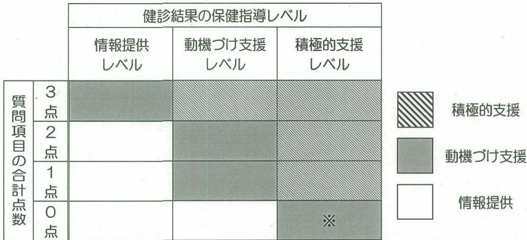
健診結果の保健指導レベルと質問項目の合計点数による保健指導の判定