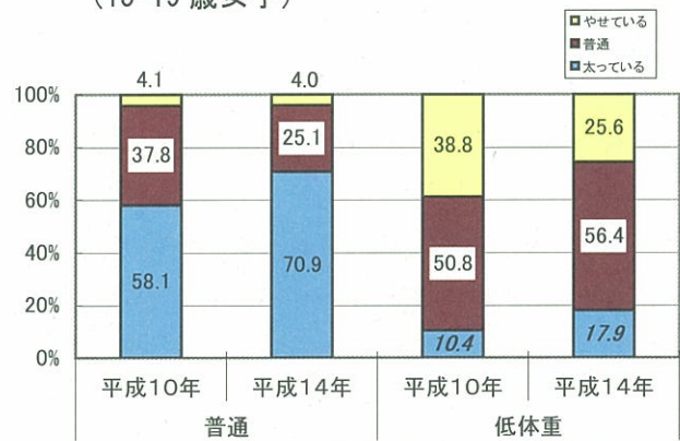
図2 現実の体型別 体型に対する自己評価 (15-19歳女子)

特に、15-19歳の女子では、平成10年と平成14年を比較すると、体型に対する自己評価について、現実の体重が「普通」「低体重（やせ）」でありながら「太っている」と評価する者が増加しています（図2）。また、「太っている」と評価する理由については、「他人と比べて」が65.8%と高率を占めています。