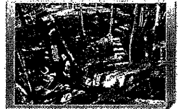
【北海道厚真町】 桜丘チャン跡の発掘調査

○ 北海道恵庭市 【雇用者数5名】 市が保管する最古の約60年前のものから最新号までの広報誌の誌面をデータベース化し、市民が容易に検索できるようにする。