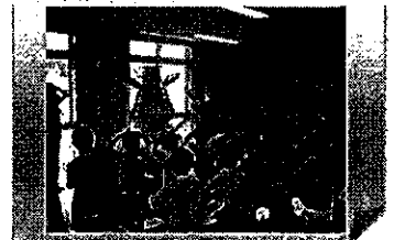
【三重県津市】 地域の歴史・文化の普及

○ 岐阜県岐阜市 【雇用者数1名】 明治後期から昭和初期までの絵はがきや写真などの画像をデータベース化し、ホームページで公開する(岐阜市歴史博物館)。