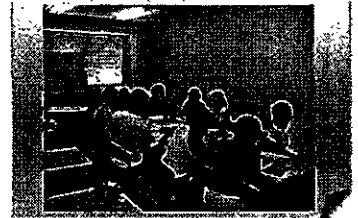
【滋賀県草津市】 外国人を対象とした日本語教育

○ 三重県津市 【雇用者数3名】 地域の歴史・文化を教えたり、市民歌の普及のため津市のキャラクター「シロモチくん」が市内の保育園、幼稚園、小学校を回るキャラバンを発足する。