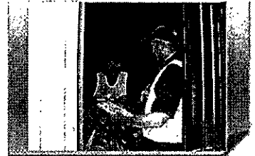
【岐阜県】 在住ブラジル人の生活実態調査

○ 富山県 【雇用者数6名】 県内の高校に就職を支援するアドバイザーを配置する。