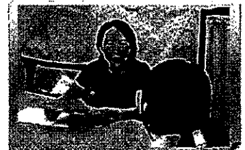
【鹿児島県】 専門相談員による生徒相談

○ 徳島県石井町 【雇用者数3名】 子どもの体力向上のため、町内の幼稚園、小学校を巡回し、担任教諭と連携して体育授業の指導を行い、体力・健康づくりから競技力アップ、指導者養成まで町内のスポーツ振興に取り組む。