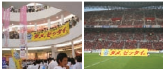
街頭キャンペーン