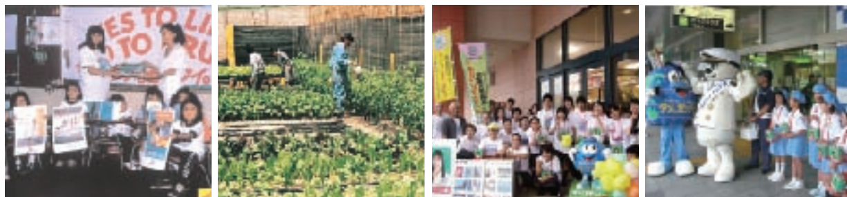
支援プロジェクト (中米・グアテマラ)