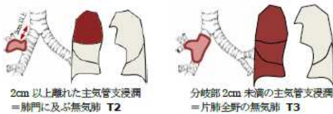
図7 主気管支浸潤のパターン