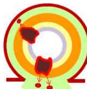
図4 Tumor deposits

注: 漿膜下層あるいは漿膜のない傍結腸・傍直腸結合組織に衛星結節(Deposits)が存在し、所属リンパ節転移がない場合をいう