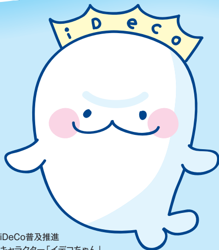
iDeCo普及推進 キャラクター「イデコちゃん」

従業員の方がiDeCoに加入されるにあたっては、事業主による事務手続きが必要となります。事業主の皆さまにおかれましては、従業員の方が速やかにiDeCoに加入できるよう、事業主としてのご協力をお願いします。