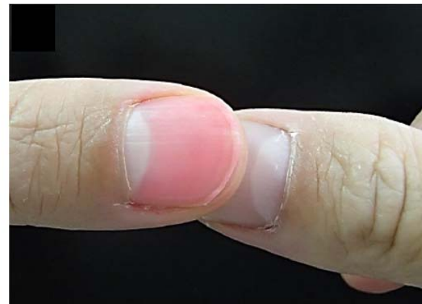
つまんだ指を離したとき、白かった爪の色がピンクに戻るのに3秒以上かかれば脱水症を起こしている可能性があります