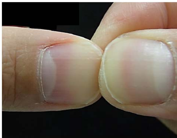
手の親指の爪を逆の指でつまむ