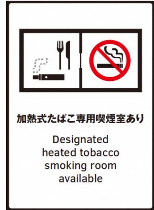
④ 指定たばこ専用喫煙室設置施設等標識