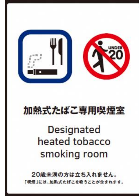
③ 指定たばこ専用喫煙室標識