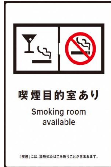
⑥ 喫煙目的室設置施設標識