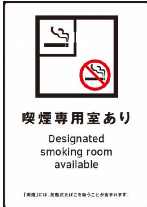
② 喫煙専用室設置施設等標識