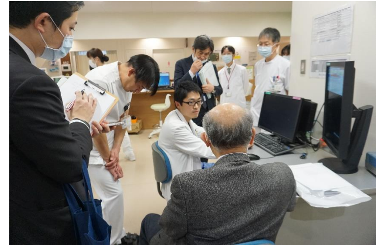
訪問調査当日の様子