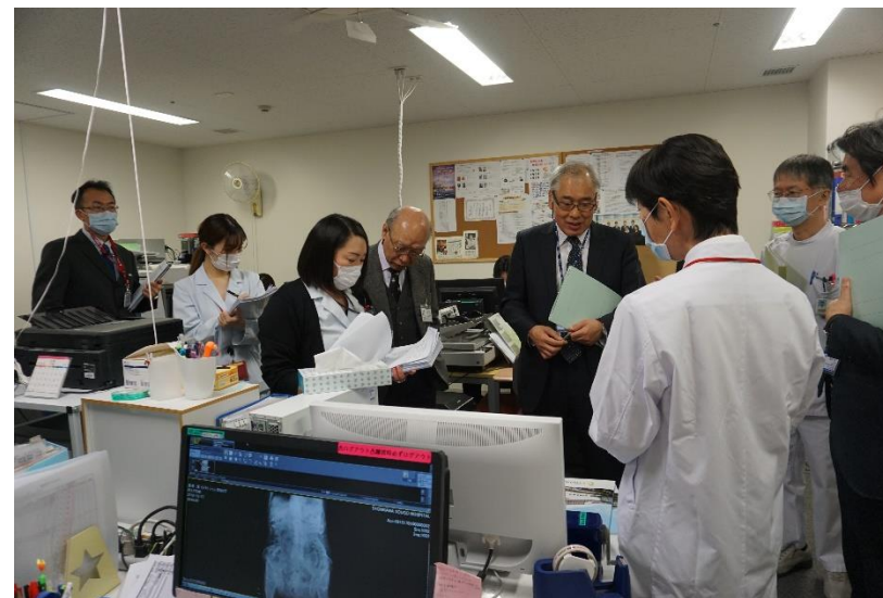
訪問調査当日の様子

業務内容：調査票各項目の整備状況確認→規定見直し・記録整備 各部署との調整、当日資料ファイリング作成 医師・研修医・病院全体への周知、等