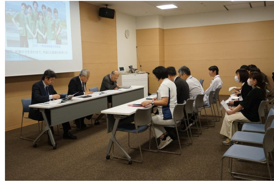
訪問調査当日の様子