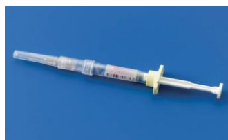
クアトロバック皮下注シリンジ (4混ワクチン)