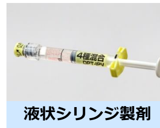
液状シリンジ製剤