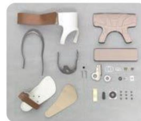
ゲイトソリューション デザイン組立キット