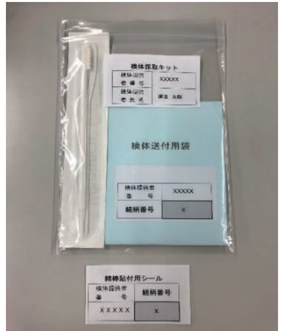
検体採取キット（御遺族用）

DNAサンプルは検体採取キットに同封されている、「検体採取要領」に従い、御自身の頬（口の内側）の粘膜を採取していただきます。