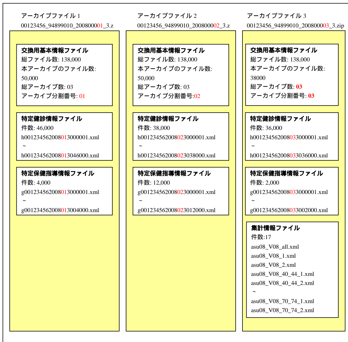
図 2 提出用アーカイブファイルを分割する場合の構成イメージ図

例えば、特定健診結果ファイル数 120,000 件、特定保健指導結果ファイル数 18,000 件を、50,000 件ずつ 3 つの提出用アーカイブファイルに格納する場合の格納イメージを示す。