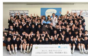
知って肝炎プロジェクト 乃木坂46による特別授業(2018年) ( http://www.kanen.org/report/20181121/ )