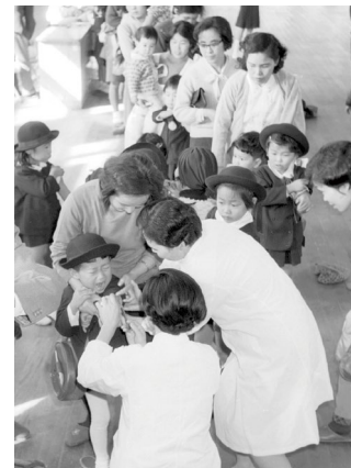
予防接種のようす(1968年)