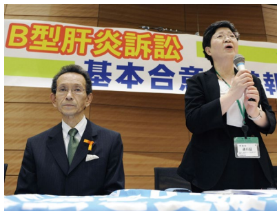
2011年全国訴訟基本合意