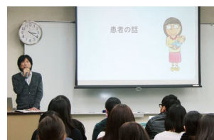
教育現場で被害体験を語る「患者講義」(2018)

同じような悲劇が繰り返されないよう、なぜ被害が起こったか原因を調査してまとめ、再発防止に取り組んでいきます。