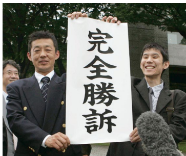
2006年先行訴訟最高裁判決

その後、2008年、全国訴訟が提起されました。2011年6月に、国は被害者に謝罪し、原告団・弁護団の間で基本合意を締結しました。2011年12月、国会は被害者を救済する法律を制定しました(特定B型肝炎ウイルス感染者給付金の支給等に関する特別措置法)。