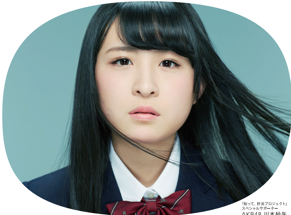
「知って、肝炎プロジェクト」 スペシャルサポーター AKB48 川本紗矢