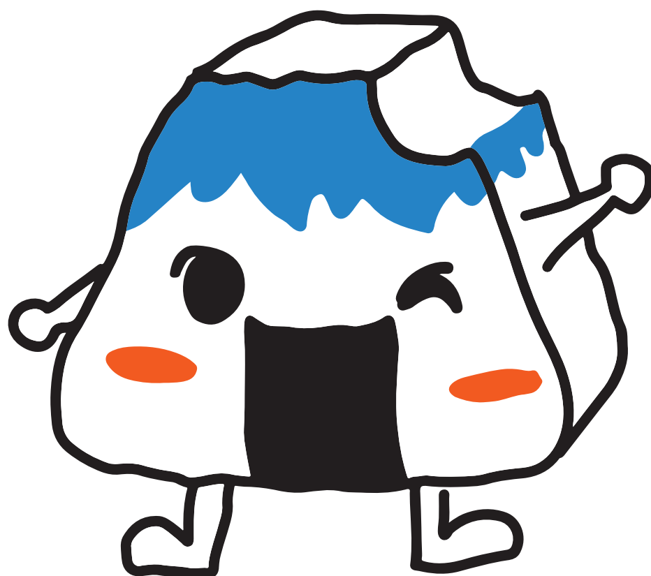
富士市食育キャラクター むすびん