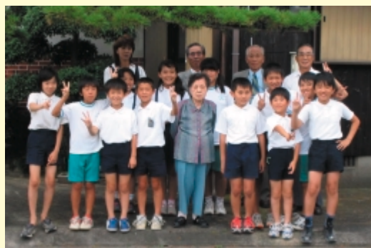
（訪問隊のメンバー）

「お元気ですか！」独居の高齢者宅に月に1回子どもたちの元気な声が響く。久留米市城島町の平野地区では、地区の江上小学校の4年生から6年生が「訪問隊」を結成し、現在は毎月第4月曜日に独居の高齢者宅を訪問して声かけと元気づけを行っている。結成から既に13年が経ち、今では近隣の高齢者にとってささやかな楽しみの一つとなっている。