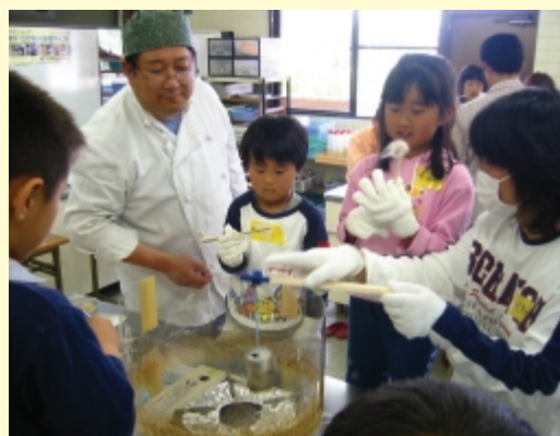
(空き缶を再利用した綿菓子づくり)

現在も料理教室が中心であるが、それ以外にも、アリの生態観察やコウモリの声を聞こうといった親と子の体験活動も行っている。