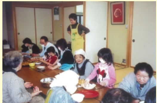
（お年寄りと子どものぼたもちづくりを通じた交流）

また、利用者が手作りおやつを持参するなど、単にサービスを利用するという受け身の姿勢ではなく、相互の交流がみられており、地域のお年寄りの心のよりどころにとどまらず、生きる張り合いを提供することにも貢献している。