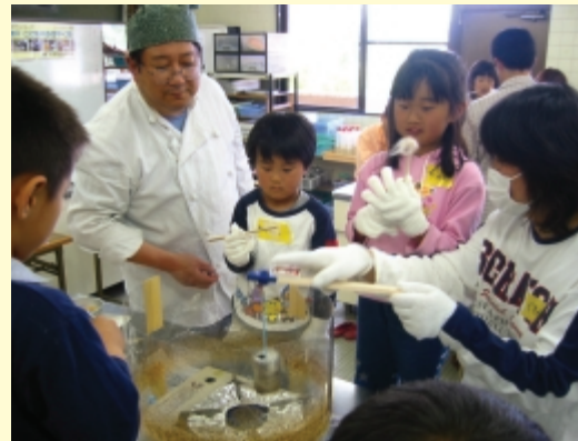
(空き缶を再利用した綿菓子づくり)

現在も料理教室が中心であるが、それ以外にも、アリの生態観察やコウモリの声を聞こうといった親と子の体験活動も行っている。