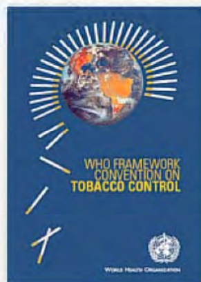
たばこ規制枠組条約 (FCTC)