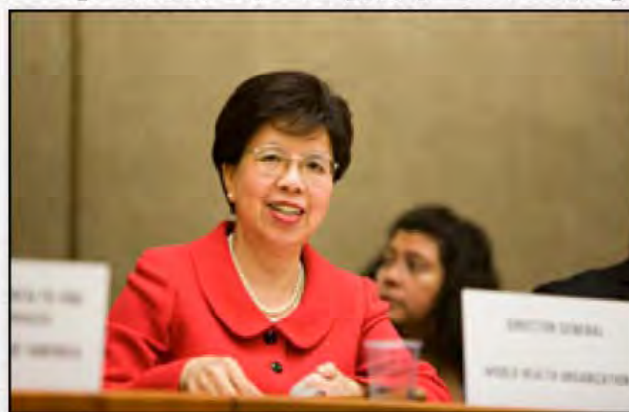
WHO事務局長 マーガレット・チャン