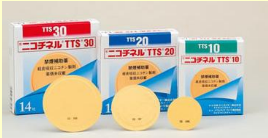
医療用ニコチンパッチ