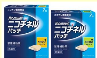
ニコチネルパッチ