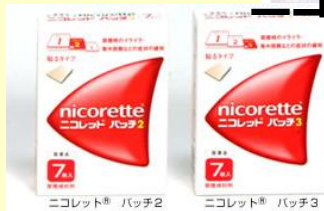
ニコレットパッチ