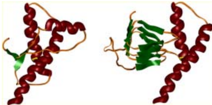
正常型プリオンたんぱく質